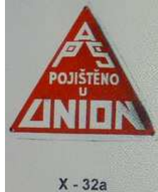
X - 32a