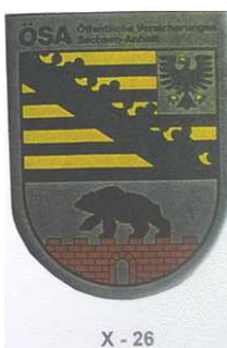
X - 26