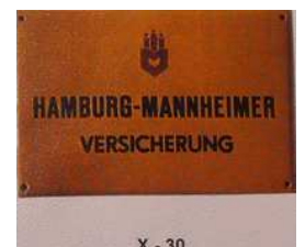
X - 30