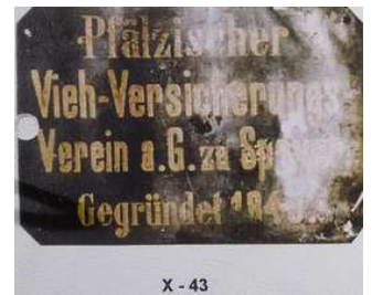
X - 43