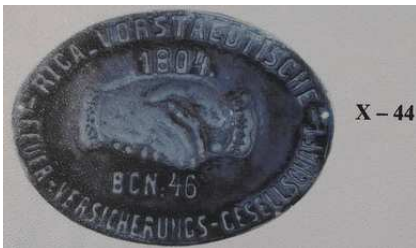
X - 44