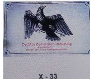
X - 33