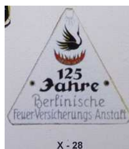
X - 28