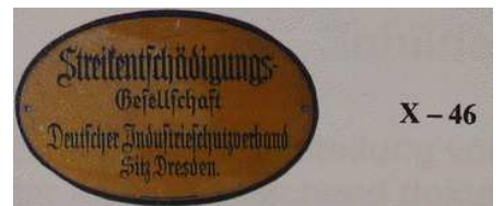
X - 46