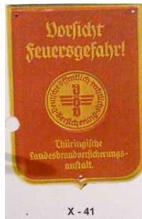
X - 41