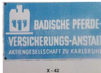
X - 42