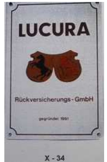
X - 34