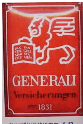
Generali Versicherungen. X-52