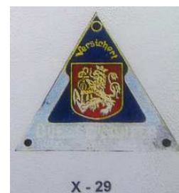
X - 29