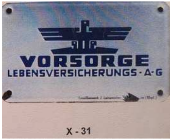
X - 31