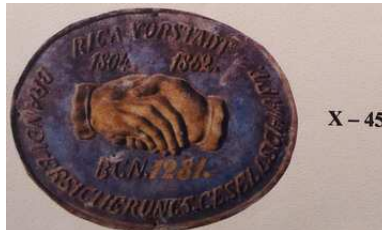
X - 45