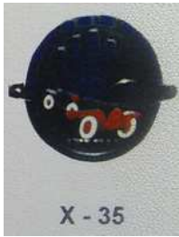
X - 35