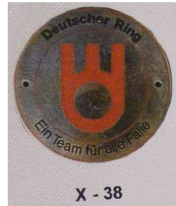
X - 38