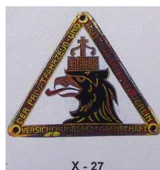
X - 27