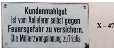
X - 47