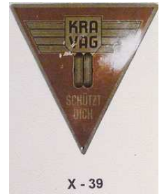
X - 39