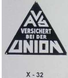
X - 32