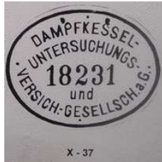
X - 37